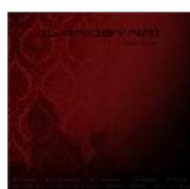
Langsyne: Silent Storm (2005)